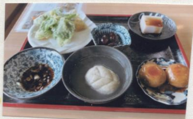
そばづくしの定食もアリ